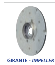
GIRANTE - IMPELLER